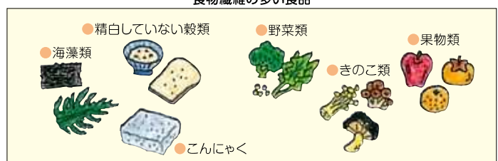
食物繊維の多い食品